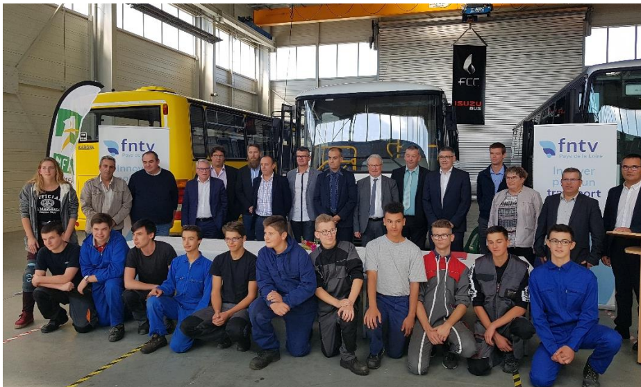
Les apprentis de la première promotion d'apprentis mécaniciens autocar du CFA de Mouilleron-Saint-Germain (85)

Face aux besoins croissants de main d'œuvre qualifiée, la FNTV Pays de la Loire s'est rapprochée de la MFR de Mouilleron Saint-Germain en Vendée en mars 2017 afin de créer une formation inédite de « mécanicien autocar en apprentissage ». Selon la FNTV, les transporteurs routiers de voyageurs de la région vont chercher à recruter plus d'une vingtaine de mécaniciens par an sur les trois prochaines années.